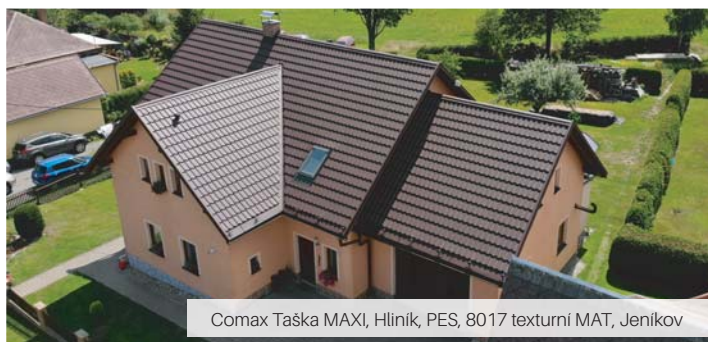
Comax Taška MAXI, Hliník, PES, 8017 texturní MAT, Jeníkov