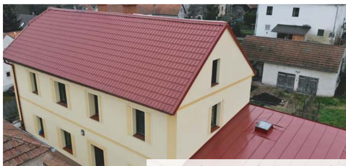
Comax Taška MAXI, Pozink, PES 3011, Vepřek