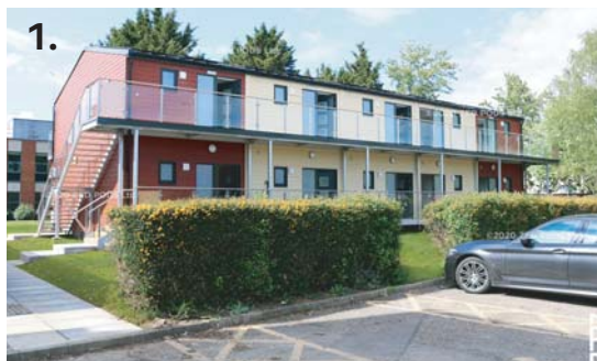
Obr. 1: Parkway Hinchingbrooke, Huntingdon PE29 6NT, UK