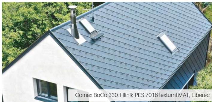
Comax BoCo 330, Hliník PES 7016 texturní MAT, Liberec